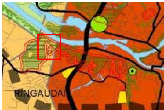
1 pav. Kauno apskrities teritorijos bendrasis planas. Apskrities teritorijos raida ir naudojimas (fragmentas)

Nagrinėjamos teritorijos Š, ŠV dalis patenka į gamtinio karkaso arealą, kuriame reglamentuojamas išlaikomo ir saugomo esamo natūralaus kraštovaizdžio pobūdis (brėžinys: „Ekologinės pusiausvyros užtikrinimas“). Taip pat nagrinėjama teritorija patenka į vaizdingo kraštovaizdžio arealą (brėžinys: „Kultūros paveldo teritorijų vystymas ir apsauga“).