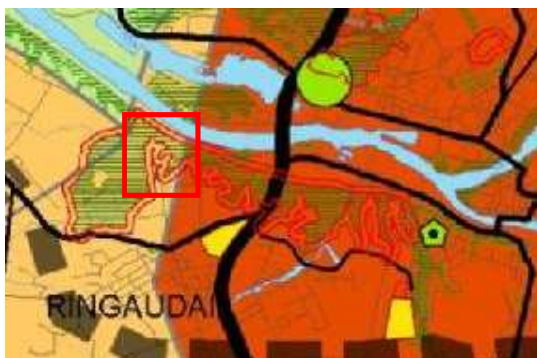
1 pav. Kauno apskrities teritorijos bendrasis planas. Apskrities teritorijos raida ir naudojimas (fragmentas)

Nagrinėjamos teritorijos Š, ŠV dalis patenka į gamtinio karkaso arealą, kuriame reglamentuojamas išlaikomo ir saugomo esamo natūralaus kraštovaizdžio pobūdis (brėžinys: „Ekologinės pusiausvyros užtikrinimas“). Taip pat nagrinėjama teritorija patenka į vaizdingo kraštovaizdžio arealą (brėžinys: „Kultūros paveldo teritorijų vystymas ir apsauga“).